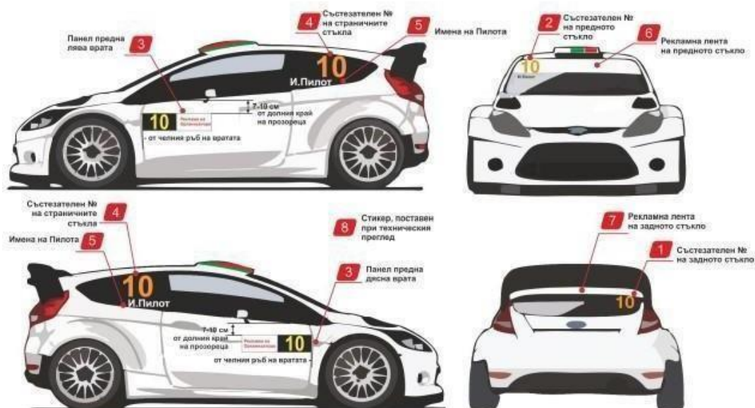
СХЕМА ЗА РАЗПОЛОЖЕНИЕ НА СЪСТЕЗАТЕЛНИТЕ НОМЕРА И РЕКЛАМИТЕ НА ОРГАНИЗАТОРА ЗА ПЛАНИНСКО ИЗКАЧВАНЕ